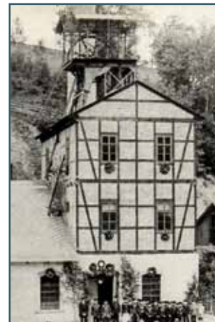
Wiederaufbau nach historischem Vorbild in Planung um 1885